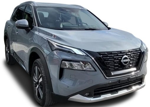
Tagesangebot Nr. AK-106037 vom 23.04.2024