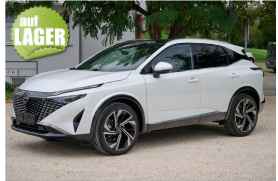
Tagesangebot Nr. K-107430 vom 17.03.2025