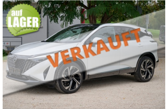
Tagesangebot Nr. K-107979 vom 06.02.2025