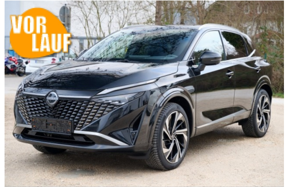
Tagesangebot Nr. K-107980 vom 17.03.2025