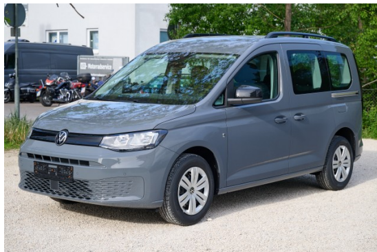
Tagesangebot Nr. AK-108153 vom 03.02.2025