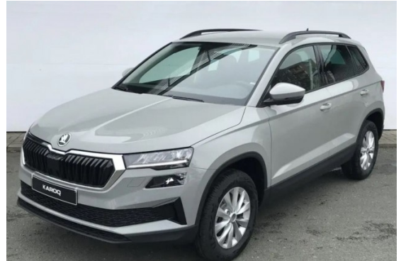
Tagesangebot Nr. AK-108230 vom 27.02.2025