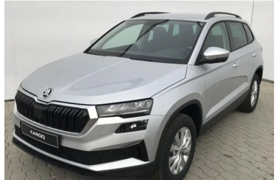
Tagesangebot Nr. AK-108274 vom 27.02.2025