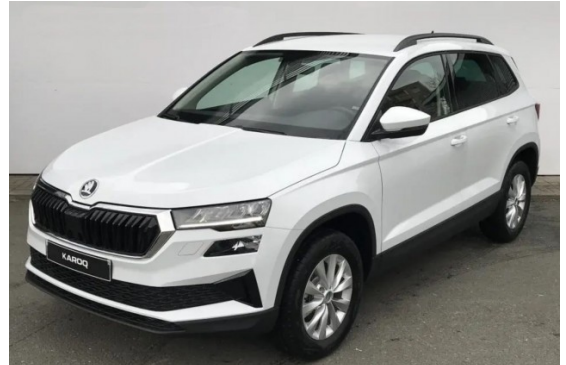
Tagesangebot Nr. AK-108291 vom 27.02.2025