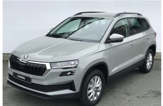
Tagesangebot Nr. AK-108290 vom 27.02.2025