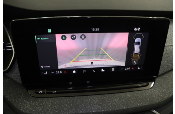
Tagesangebot Nr. AK-108451 vom 24.03.2025